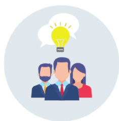
1: Samarbejde med eksterne aktører