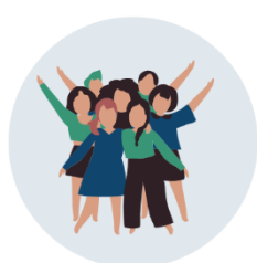
2: Samarbejde på tværs af enhederne i FVST