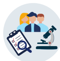
4: Mistankekontroller og autenticitetsanalyser