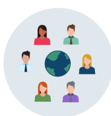
3: Indspil til internationalt samarbejde