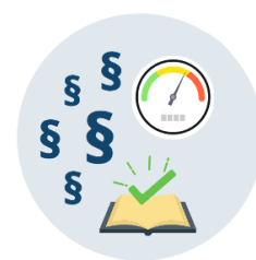
5: Nye regler trykprøves ift. risikoen for svindel

SBS vil fortsat i relevant omfang inddrage øvrige enheder i Fødevarestyrelsen. Gruppen inddrager ligeledes løbende relevante eksterne partnere som IFRO, DTU, KU, Skattestyrelsen, Toldstyrelsen, Landbrugsstyrelsen, Politiet, brancheorganisationer og NGO'er i sit arbejde.